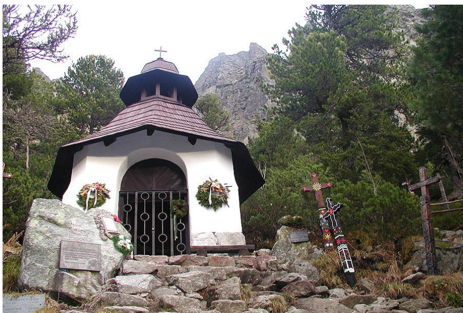
Symbolický cintorín pri Popradskom plese