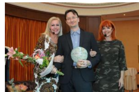
Ikariáda 2012 (cena Zlatá kniha – V tieni mafie II. )

Mrazivý triler o priateľstve a láske, ktoré sa zmenili na smrteľnú nenávisť. Dvaja nerozluční priatelia vyrastajú koncom dvadsiatych rokov minulého storočia v malom slovenskom meste. Po tragickej udalosti sú nútení utiecť do zahraničia a opustiť dievča, o ktoré súperia. Jeden emigruje do New Yorku. Stane sa pešiakom obávaného židovského gangu, zažije krvavú vojnu najmocnejších mafiánskych rodín a stúpa v hierarchii podsvetia. Druhý sa ocitne v Mnichove, kde ho zverbuje do nacistickej tajnej služby. Zúčastní sa na mnohých vražedných akciách a postupne sa mení na beštiálneho dôstojníka SS. Po vypuknutí vojny sa opäť stretávajú. Vydrží ich priateľstvo ťažkú skúšku – alebo sa z nich stanú nepriatelia na život a na smrť?